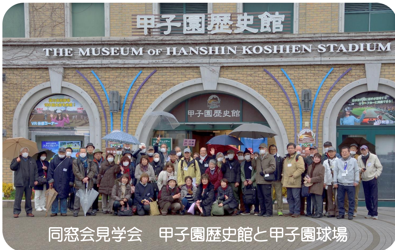
同窓会見学会 甲子園歴史館と甲子園球場