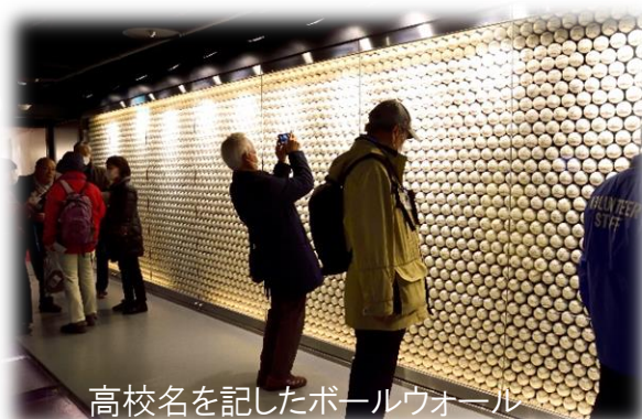
高校名を記したボールウォール

◇同窓会見学会 甲子園歴史館と甲子園球場 ◇第24回 同窓会総会の開催 ◇編集あとがき