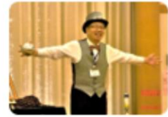
マリンバコンサート